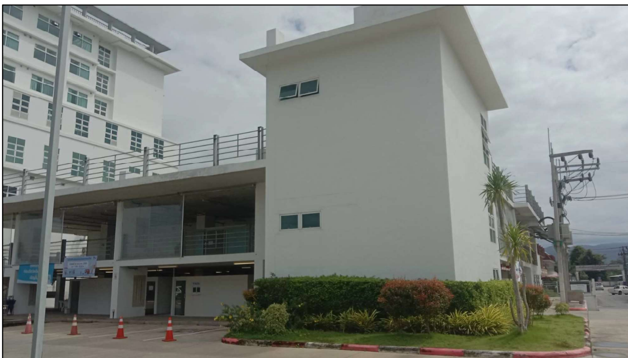
รูปที่ 1-2 ภาพพื้นที่โครงการปัจจุบัน